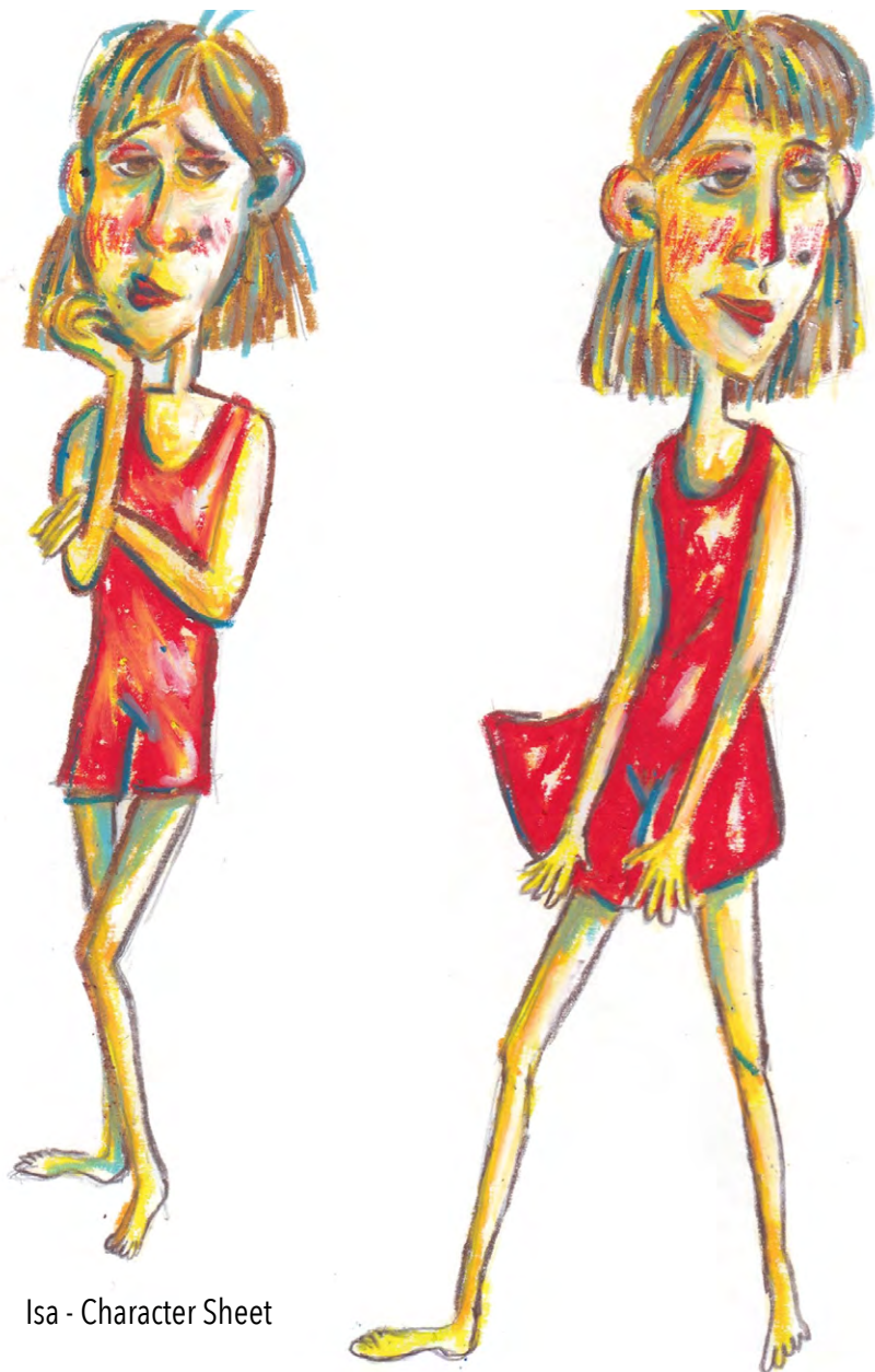
Isa - Character Sheet