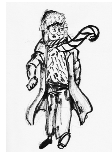
Arturo - Exploration