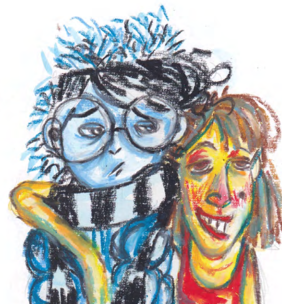
Arturo - Character Sheet