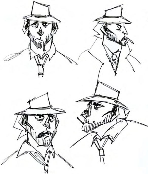
Cosimo - Character Sheet

Essere o non essere. Preferiresti vivere la vita soffrendo o cercando vendetta rischiando la morte?