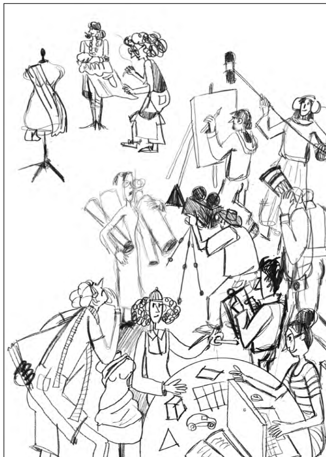
Illustrazione realizzata per una pubblicità dell'istituto IED pubblicata per la rivista LA FINE DEL MONDO, edita con il Manifesto (Uscita prevista per il Lucca Comics 2025). La tecnica utilizzata è stata quella della gouache, matite colorate e pastelli ad olio.